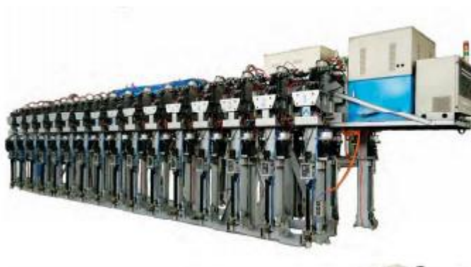
久达产品--全自动阳极母线提升框架